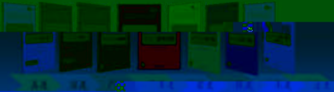
一体化课程教学设计 综合实训基地